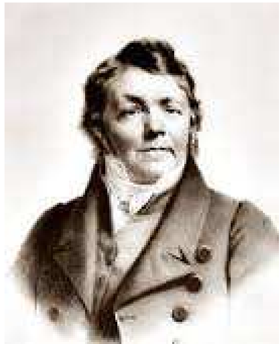
JOHANN NEPOMUK HUMMEL

Najpoznatiji je kao otac Ludwiga van Beethovena.