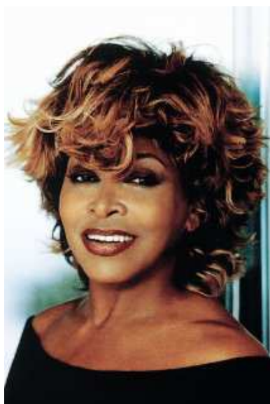
TINA TURNER 26. 11. 1939.

Ova kontroverzna američka glumica i pjevačica, pravim imenom Destiny Hope Cyrus, slavu je postigla ulogom Miley Stewart/Hannah Montane u Disneyevoj seriji Hannah Montana . Snimila je glazbu za seriju te je s uspjehom marke Hanne Montana postala idolom tinejdžera. U animiranom filmu Bolt (Grom) iz 2008. posudila je glas liku Penny i bila je nominirana za Zlatni globus u kategoriji Najbolja originalna pjesma iz filma ( I Thought I Lost You ). Imidž “zločeste” cure pokrenula je 2009. g., kako bi se odmaknula od “dobre” cure Hannah.