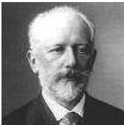
PETAR ILJIČ ČAJKOVSKI