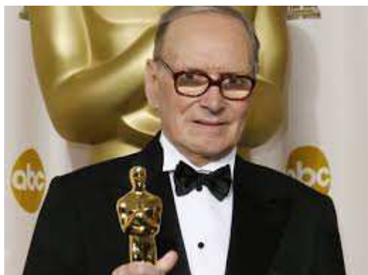
ENNIO MORICONE 10. 11. 1928.

Tamo je diplomirala u svibnju 2003. godine. Osvojila je dojmljiv niz nagrada i međunarodnih natjecanja, a od početka karijere izvela je tisuće recitala diljem svijeta.