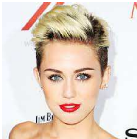
MILEY CYRUS 23. 11. 1992.

Ova kontroverzna američka glumica i pjevačica, pravim imenom Destiny Hope Cyrus, slavu je postigla ulogom Miley Stewart/Hannah Montane u Disneyevoj seriji Hannah Montana . Snimila je glazbu za seriju te je s uspjehom marke Hanne Montana postala idolom tinejdžera. U animiranom filmu Bolt (Grom) iz 2008. posudila je glas liku Penny i bila je nominirana za Zlatni globus u kategoriji Najbolja originalna pjesma iz filma ( I Thought I Lost You ). Imidž “zločeste” cure pokrenula je 2009. g., kako bi se odmaknula od “dobre” cure Hannah.