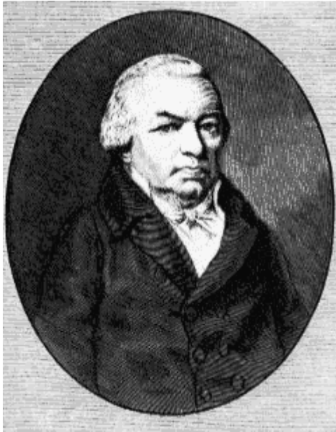
JOHANN VAN BEETHOVEN