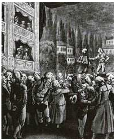
Premijera Otmice iz seraja 1782.

Uvrijeđen, glazbenik je odgovorio svojom uobičajenom drskošću: "Gospodine, nijedna nije višak" .