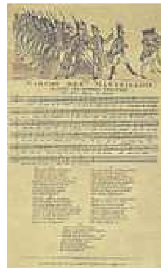
Tekst i glazba Marseljeze

Marseljeza je proglašena državnom himnom Francuske 14. srpnja 1795. g.