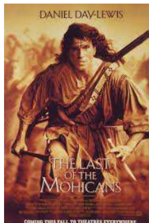
Posljednji Mohikanac 1992.