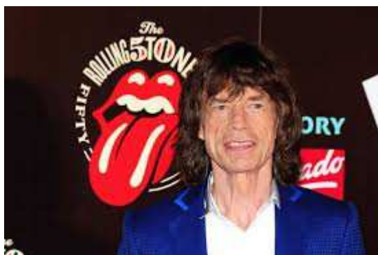
MICK JAGGER 26. 07. 1943.

Engleski je rock glazbenik, glumac, tekstopisac, filmski producent i biznismen.