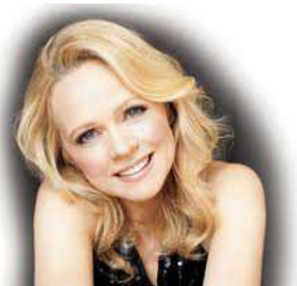
TAJČI 1. 07. 1970.

Hrvatska je pjevačica i jedna od većih pop zvijezda ranih 1990-ih godina. Postala je zvijezda pobjedom na Jugoviziji s pjesmom Hajde da ludujemo . 1990. g. je nastupila na Euroviziji u Zagrebu i osvojila 7. mjesto. 1992. g. seli se u SAD gdje je nastavila s glazbenim i scenskim usavršavanjem, pojavljujući se povremeno u mjuziklima i na televiziji u Los Angelesu. Danas živi u Cincinnatiju, pjeva duhovnu glazbu te nastupa u katoličkim crkvama.