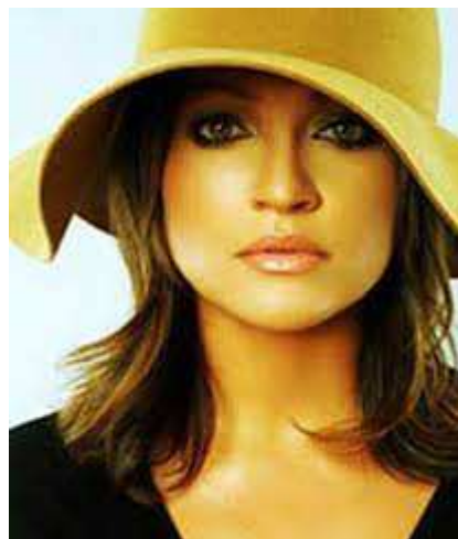
NINA BADRIĆ 4. 07. 1972.

Hrvatska je pjevačica i jedna od većih pop zvijezda ranih 1990-ih godina. Postala je zvijezda pobjedom na Jugoviziji s pjesmom Hajde da ludujemo . 1990. g. je nastupila na Euroviziji u Zagrebu i osvojila 7. mjesto. 1992. g. seli se u SAD gdje je nastavila s glazbenim i scenskim usavršavanjem, pojavljujući se povremeno u mjuziklima i na televiziji u Los Angelesu. Danas živi u Cincinnatiju, pjeva duhovnu glazbu te nastupa u katoličkim crkvama.