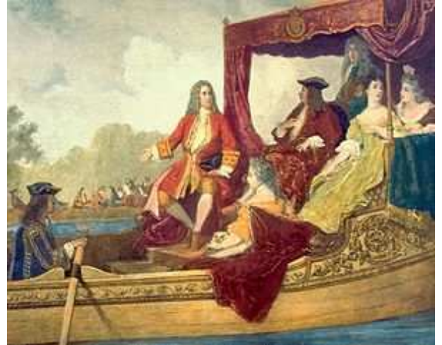
Georg Friedrich Händel i britanski kralj George I. na brodu tijekom vožnje Temzom.

Händel je bio jako cijenjen među kolegama skladateljima, i tijekom života i nakon njega.