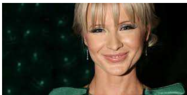
DANIJELA MARTINOVIĆ 15. 07. 1971.

Hrvatska je pjevačica zabavne i jazz glazbe. Supruga je Arsena Dedića. U mladosti je dobila je ponudu da pjeva na zapadnom tržištu, ali je odustala jer nije htjela pristati na promjenu izgleda i druge uvjete. Dobila je Porina (2003.) za najbolju žensku vokalnu izvedbu, a 2006. g. za poseban doprinos hrvatskoj zabavnoj glazbi.