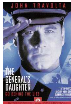
Generalova kći 1999.