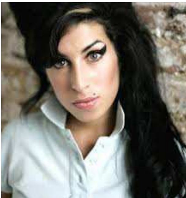
AMY WINEHOUSE 23. 07. 2011.

Bila je britanska pjevačica i tekstopisac poznata po svojim jakim vokalima i mješavini glazbenih stilova koji su uključivali R&B, soul i jazz.