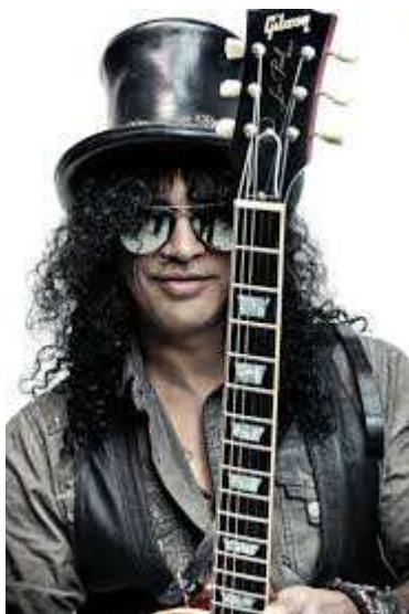
SLASH 23. 07.1965.

Bivši je gitarist hard rock benda Guns N' Roses kojeg je napustio 1996. g. Od 2003. g. svira u bendu Velvet Revolver a njihov prvi singl Set Me Free bio je dio soundtracka za film Hulk .