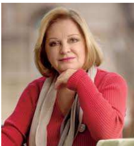
GABI NOVAK 8. 07. 1936.

Četiri puta se natjecala na Dori , a Hrvatsku je na Eurosongu predstavljala 2012. g. s pjesmom Nebo .