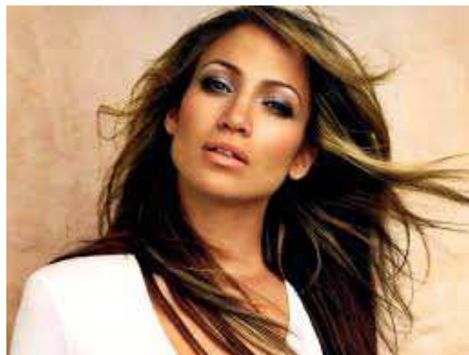
JENNIFER LOPEZ 24. 07. 1969.

17. siječnja 2007. g. dodan je u Hollywood Rock Walk of Fame . Posjeduje između 85 -110 gitara.